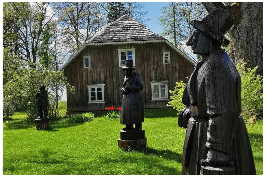
Reiņa un Matīsa Kaudzīšu memoriālais muzejs "Kalna Kaibēni" Vecpiebalgā.

No 1868. gada līdz 1882. gadam šajā ēkā atradās brāļu Kaudzīšu vadītā pagastskola.