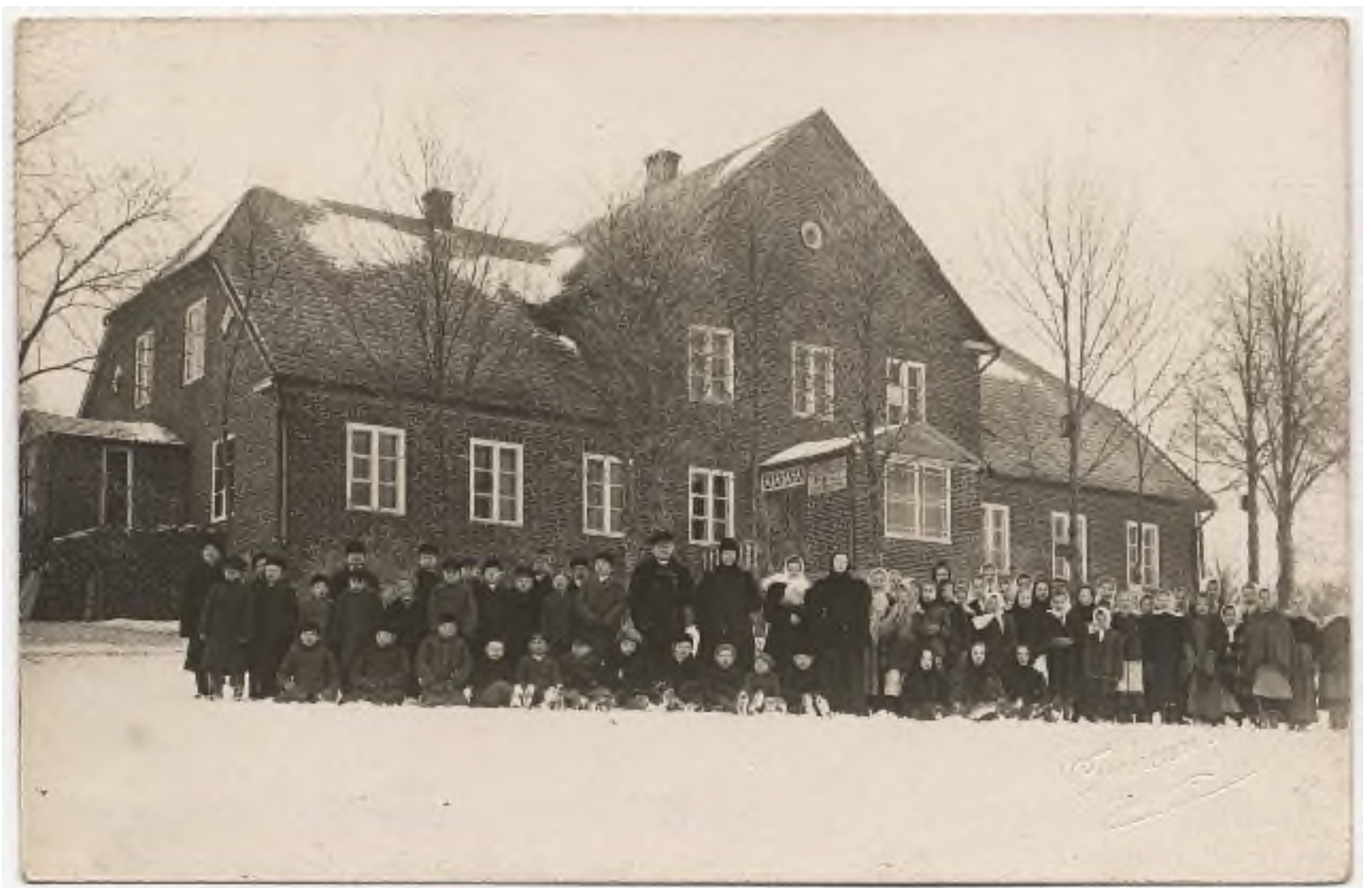
Matīss Kaudzīte skolēnu vidū. Ap 1908. gadu.

1868. gadā, nokārtojis skolotāja eksāmenu, M. Kaudzīte kļuva par skolotāju Kalna Kaibēnu pagastskolā (vēlāk Ogrēnu skolā). Matīss Kaudzīte skolotāja darbā nostrādāja 43 gadus, līdz 1911. gadā aizgāja pensijā, tomēr arī pēc tam laiku pa laikam strādāja Ogrēnu skolā.